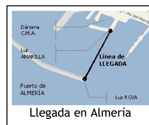
Llegada en Almería

Esta regla no reduce, modifica ni exonera la responsabilidad de cada barco de salir conforme al RRV.