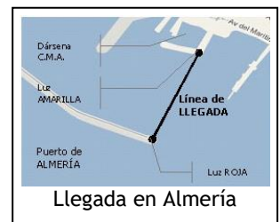
Llegada en Almería

Esta regla no reduce, modifica ni exonera la responsabilidad de cada barco de salir conforme al RRV.